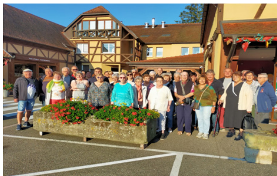
Le groupe devant le palais du pain d'épices

Chaque participant a apprécié cette semaine certes intense mais dans une ambiance chaleureuse et joyeuse qui permet d'oublier les soucis quotidiens l'espace de quelques jours.